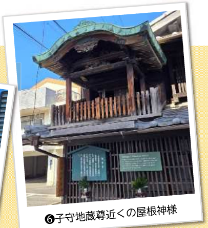
⑥子守地藏尊近くの屋根神様