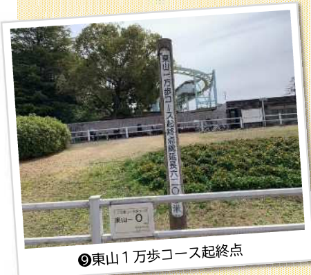
⑨東山1万歩コース起終点