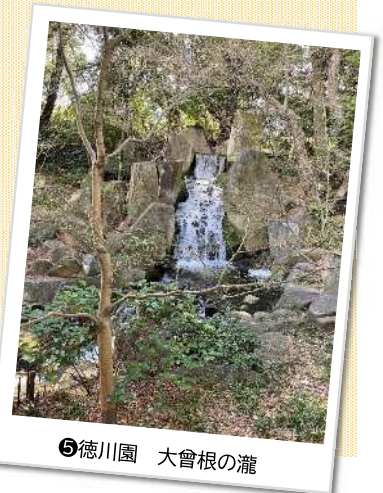
⑤徳川園 大曾根の瀧