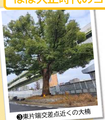
③東片端交差点近くの大楠