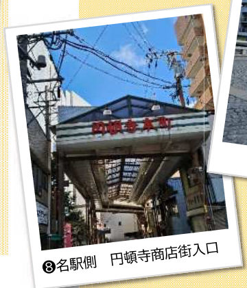
⑧名駅側 円頓寺商店街入口